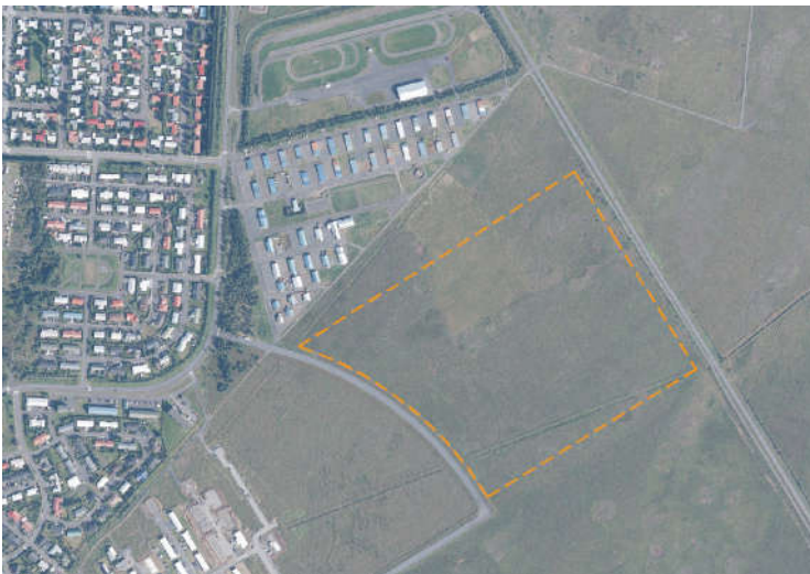
MYND 1 Yfirlitsmynd

Í Aðalskipulagi Árborgar 2010 - 2030 1 er gert ráð fyrir íbúðabyggð (N13) sunnan hesthúsahverfis og austan við Austurhóla sem liggur frá Langholti að Suðurhólum. Skipulagssvæðið er um 20 ha að stærð. Með deiliskipulaginu er verið að skapa svæði til frekari uppbyggingar íbúða í Árborg og svara þannig vaxandi eftirspurn eftir íbúðarlóðum innan sveitarfélagsins.