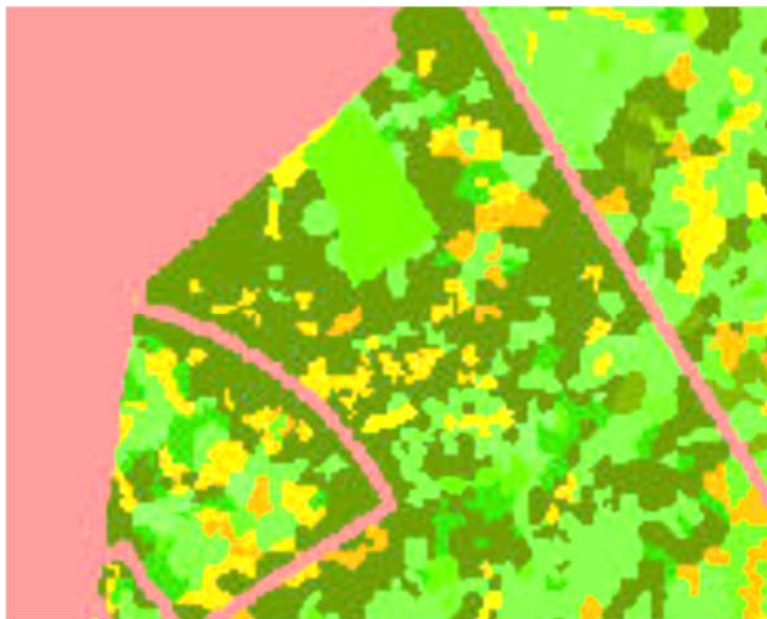
MYND 2 Vistgerðakort af svæðinu. Kortlagningin byggir að mestu leyti á fjarkönnun.

Samkvæmt vistgerðakorti Náttúrustofnunar Íslands eru innan skipulagssvæðisins meðal annars vistgerðir með mjög hátt og hátt verndargildi. Í umsögn Umhverfisstofnunar við lýsingu aðalskipulagsbreytingar kemur fram að mikilvægt sé að fjalla um umhverfisáhrif í deiliskipulagstillögunni. Meta þarf umhverfisáhrif tillögunnar, hvaða aðgerðum verði beitt til að draga sem mest úr áhrifum framkvæmda og hvaða leiðir verði farnar til að draga úr neikvæðum umhverfisáhrifum á vistgerðirnar.