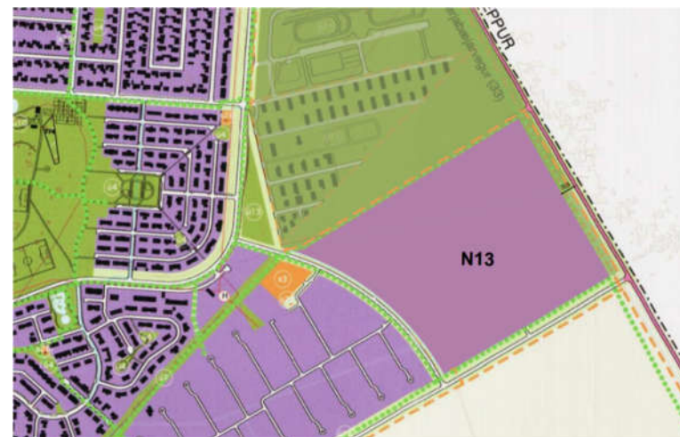
MYND 3 Aðalskipulag Árborgar 2010-2030 eftir breytingu

Deiliskipulagstillagan er unnin á grundvelli núgildandi Aðalskipulags Árborgar 2010-2030, með síðari breytingum, þar sem svæðið er skilgreint sem íbúðarsvæði. Æskilegt er að þéttleikinn fari hvergi undir 35 íb/ha svo hagkvæmni náist.